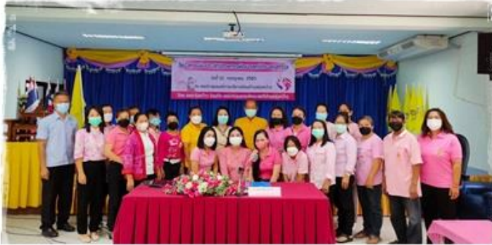
โครงการเพิ่มประสิทธิภาพการพัฒนาสตรี ต.ทุ่งกว้าว