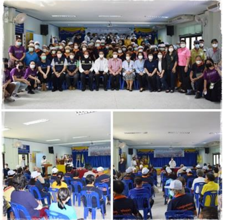
โครงการโรงเรียนผู้สูงอายุ