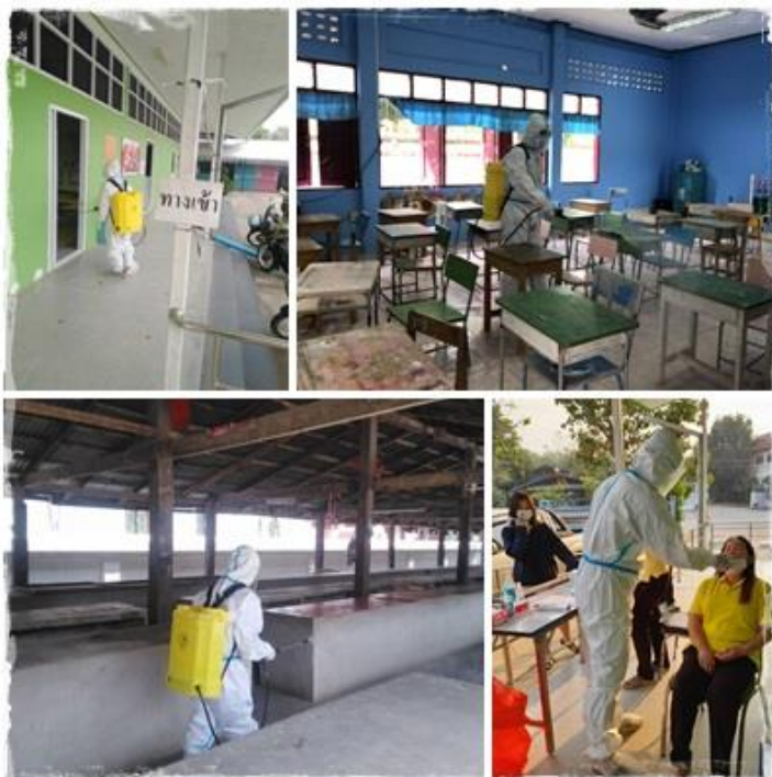
การป้องกันและควบคุมโรคช่วงการระบาด ของเชื้อไวรัสโคโรนา 2019 หรือ โควิด - 19