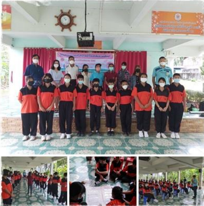
โครงการเยาวชนทุ่งกว้างเข้าใจเอตส์และเพศศึกษา