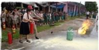
โครงการฝึกซ้อมแผนป้องกันบรรเทาสาธารณภัย